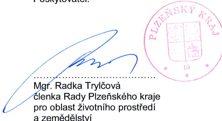
Mgr. Radka Trylčová členka Rady Plzeňského kraje pro oblast životního prostředí a zemědělství